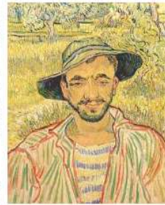
VON GOGH IL GIARDINIERE

L'austera galleria con le colonnate e l'atrio neopalladiano, ha preso vita. Via la polvere, ora tutto brilla a cominciare dal riverbero di un pavimento di specchi che apre la visita, spettacolare sala allestita da Alfredo Pirri con lastre di specchi incrinati e spezzati su cui galleggiano sculture ottocentesche vagando come fantasmi o iceberg fino a far diventare piccola piccola anche Kiki Smith. (quando si dice corto circuito fra contemporaneo e passato).