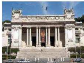
GALLERIA NAZIONALE D'ARTE MODERNA

Oppure: la sala dell'Ercole di Canova, messo in scena come un campione del wrestling tra due file di neoclassiche divinità che manca solo che applaudano (ed è diventata la più bella sala conferenze della capitale). L'Ottocento è teatro e narrazione. E il nostro di Ottocento è pieno di talenti. Mai valorizzati abbastanza. Ma qui esplodono in tutta la loro forza di teatro, narrazione e pittura.