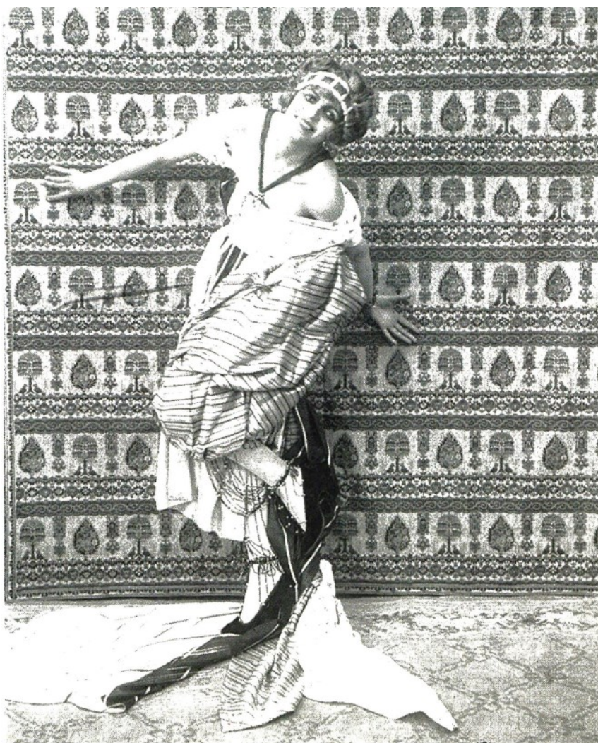
Fotogramma Una immagine tratta dal film di Anton Giulio Bragaglia, «Thais», del 1917, con scenografie di Enrico Prampolini