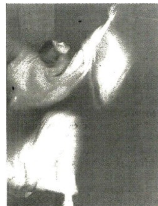
Danzatrice Ritratto fotografico di Jia Ruskaja