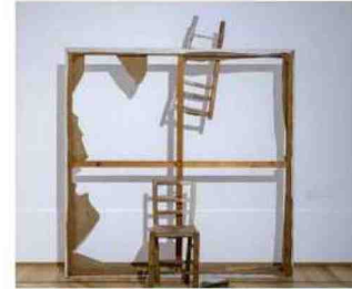
Un'opera di Vasco Bendini