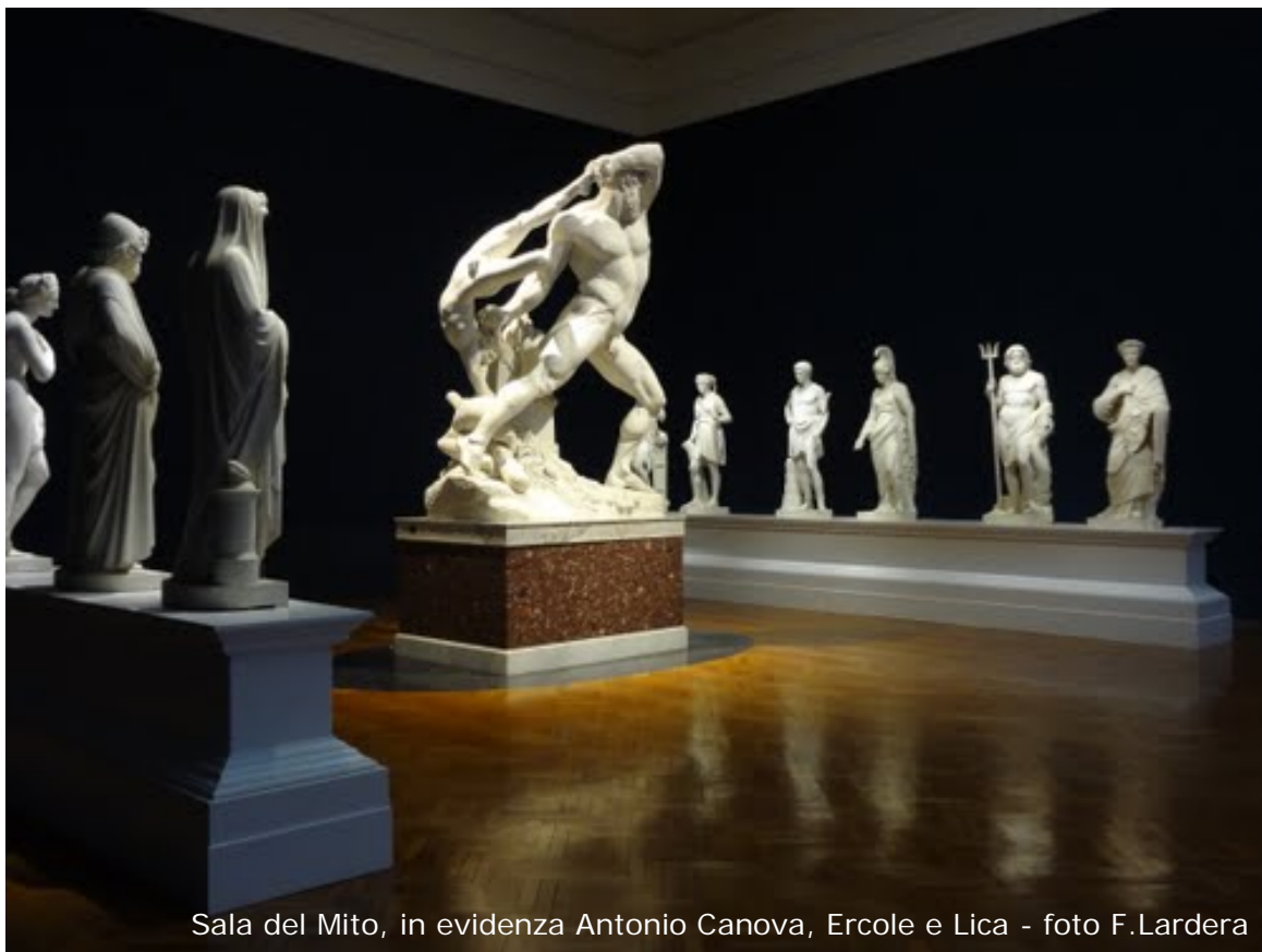
Sala del Mito, in evidenza Antonio Canova, Ercole e Lica

il sabato e la domenica GNAM—sala del Mito