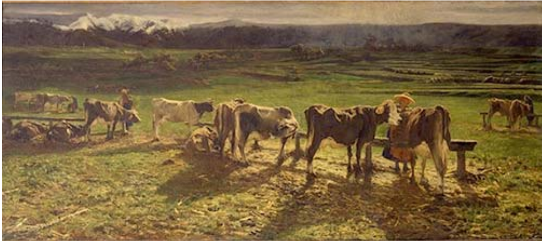
Giovanni Segantini, Alla stanga , 1886, GNAM

In occasione del restauro del dipinto di Giovanni Segantini “Alla Stanga”, la Galleria nazionale d’arte moderna e l’Istituto Superiore Centrale per il Restauro organizzano visite guidate gratuite al cantiere di restauro, con illustrazione dell’intervento in corso.