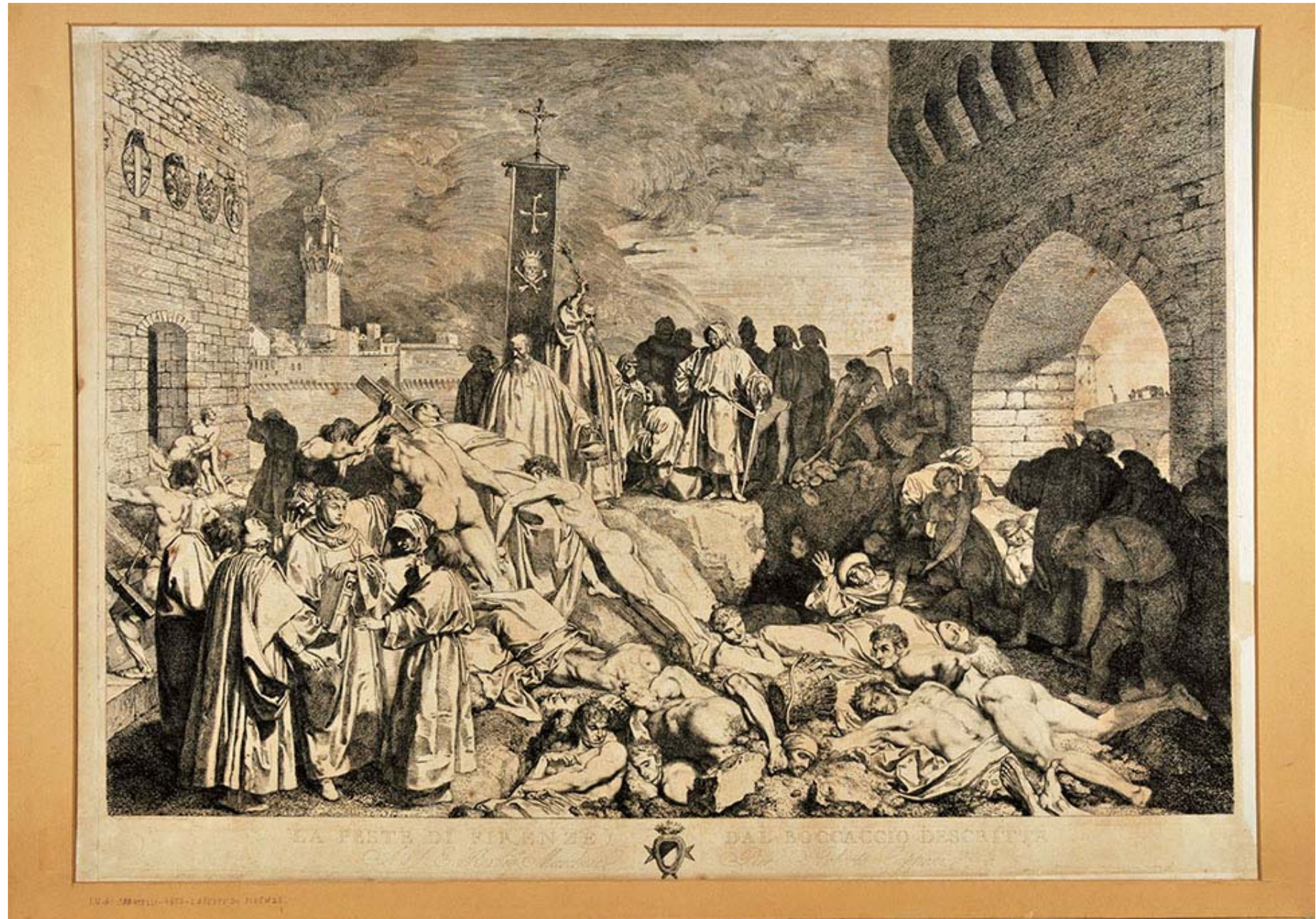
Luigi Sabatelli, La peste di Firenze , 1801

Viale delle Belle Arti 131 00196 Roma Telefono info 06 32298 221 Fax 06 322 1579 Mail s-gnam@beniculturali.it www.gnam.beniculturali.it