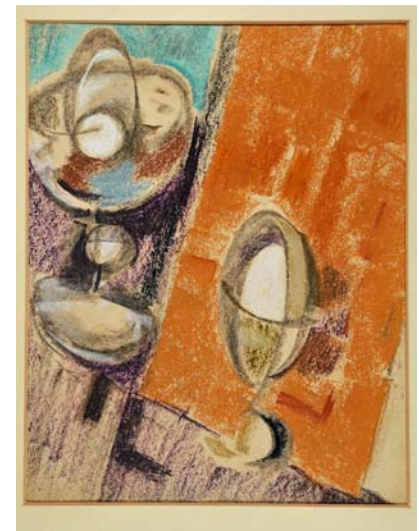
Natura morta , anni '50

Con l'esposizione dei disegni di Luigi Sabatelli (1772 Firenze – 1850 Milano) e di Fausto Pirandello (Roma 1899 – 1975) prende l'avvio un programma espositivo a cura di Rita Camerlingo che, con rotazione trimestrale , intende rendere disponibile al pubblico parte delle raccolte su carta del XIX e del XX secolo conservate nel museo