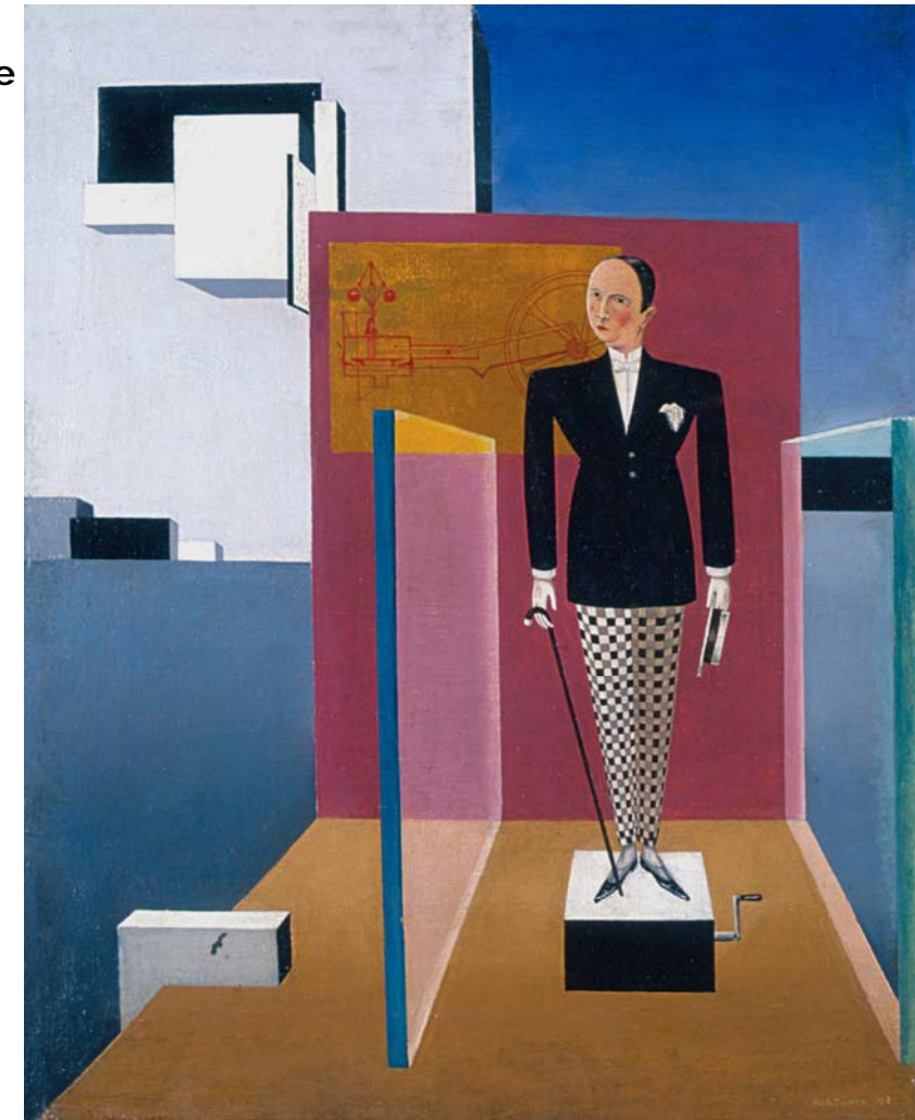
Bortnyik Sandor, Il nuovo Adamo , 1924

La mostra resterà aperta al pubblico fino al 15 settembre 2013