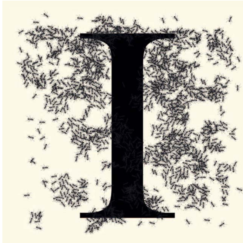
Emilio Isgrò, Modello Italia , 2012

La mostra intende mostrare e dimostrare, in una sorta di percorso a ritroso, l'attualità dell'arte di Isgrò, ma anche come le ultime opere siano strettamente legate alle prime. Le installazioni spettacolari e complesse dell'ultimo periodo si compongono infatti degli elementi delineati già dagli anni sessanta e settanta, proseguendo e ampliando le tematiche e i segni primitivi dell'artista