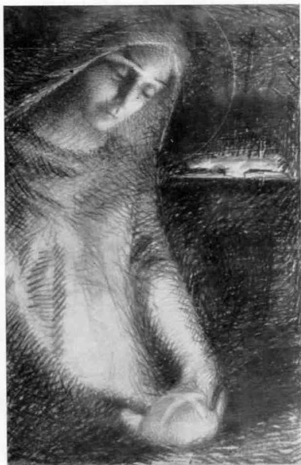
La Vergine e il pane

Nei quadri « suoi », quelli che non erano destinati ad altari o conventi, conservò la sua libera, talvolta ardita inventiva, ricercando costantemente una