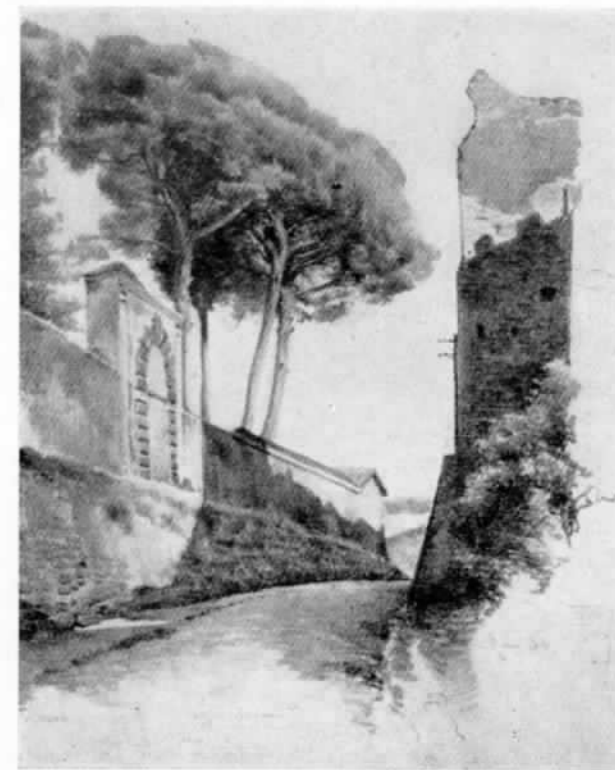
Rocca de Savelli - Roma 1911

derla. Ma la salute non lo sosteneva più. Un male, dapprima insidioso poi sempre più insistente, cominciò a minare la sua forte fibra; un vero e proprio avvelenamento del sangue, cui forse contribuì l'assorbimento costante dell'ossido di piombo dei suoi adorati colori. Negli ultimi sei mesi del 1959, alterne dolorose vicende lo portarono due volte, per lunghe settimane, in clinica. Da ciascuna delle degenze, specie dall'ultima, tornò come rasserenato, svelenato, senza più ribellioni intime contro il male: riappacificato con gli uomini, ma specie col suo Gesù. Trascorse la vigilia di Natale a lavorare ad un pastello « suo » lasciato così nello studio: da uno scheletro crocifisso si libra verticalmente, purissima, la figura bianca, tutta luce e sintesi geometrica, di Cristo. Mentre lavorava era lieto come nei tempi belli della sua piena serenità.