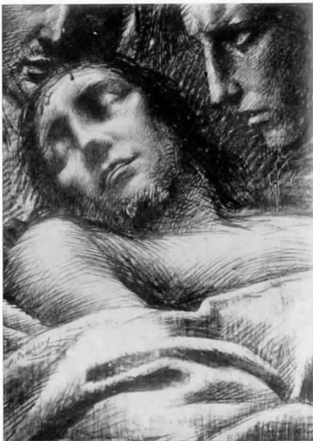
Dalla « Via Crucis »: « Deposizione »

Così, nel decennio 1930-1940 ed oltre, l'artista oramai maturo, confortato negli affetti dalla presenza dolce della mamma e della perfetta compagna della sua vita, lavorò incessantemente nel campo dell'arte sacra, ricevendo ordinazioni oltre che da tutta Italia, dall'America del Sud, (Buenos Ayres, S. Paulo, ecc.) dagli Stati Uniti (Chicago, Michigan, ecc.) dal Canada (Quebec, Montreal, ecc.) dalle Missioni d'Africa, da Manila, dall'Oriente, dall'Europa tutta. Inviò ovunque Vie Crucis, pale d'altare, ritratti, e parlarono di questi lavori riviste olandesi, belghe, francesi, polacche, cecoslovacche, ecc. Nelle tele su ordinazione mantenne sempre il rispetto della forma e delle leggi della natura e del disegno, nella coerenza del suo principio d'artista tendente ad affermare che non doveva essere la forma esteriore a venire sconvolta da modernismi superficiali, ma il concetto del quadro religioso a staccarsi da una rappresentazione fredda e distaccata del soggetto, per essere nutrito del sentimento mistico e dell'afflato della fede.