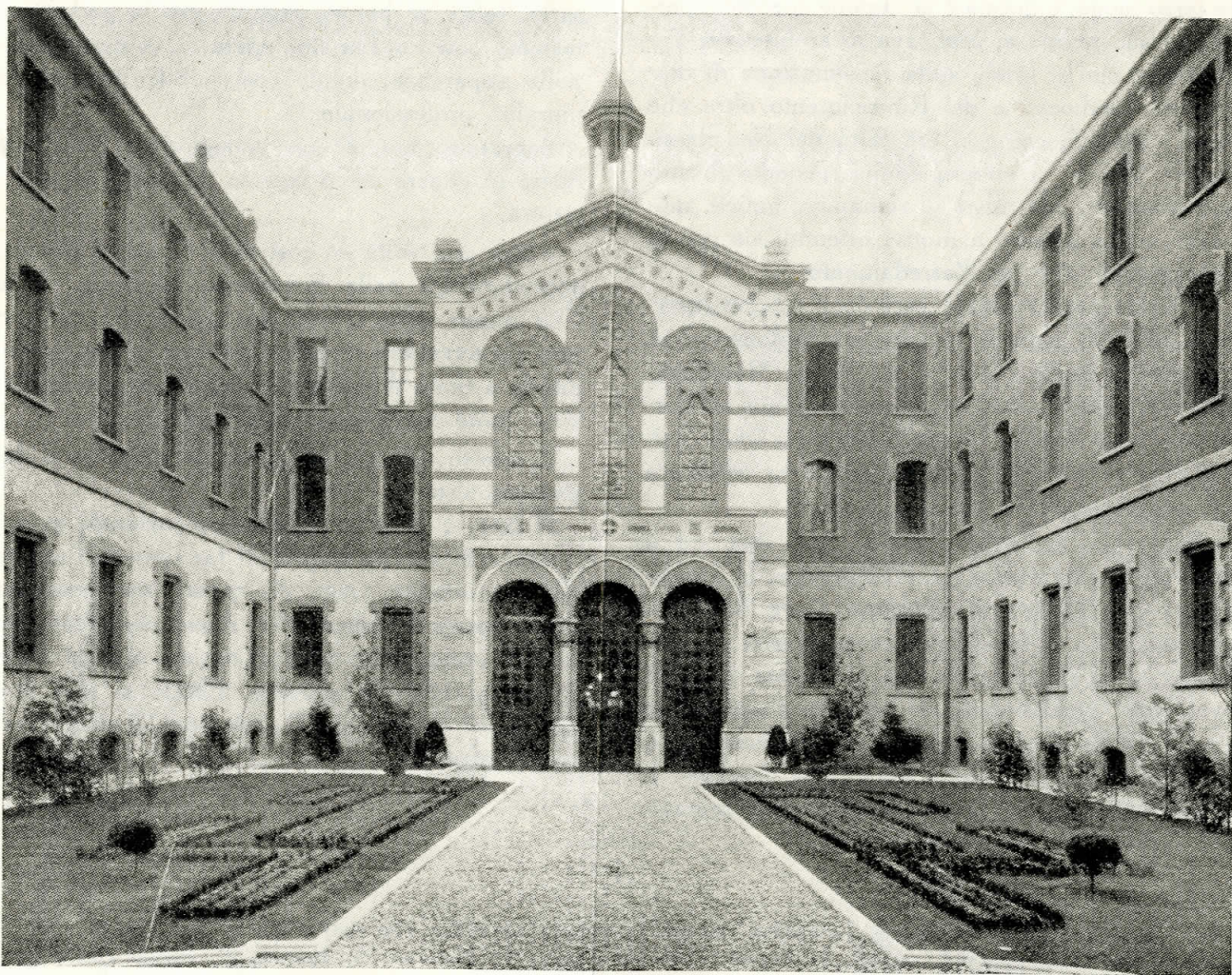
La Casa di riposo per musicisti « Giuseppe Verdi » - Il cortile d'onore e la cripta che conserva le spoglie del grande musicista (1899) - Milano

Nel 1906, nominato Presidente della Sezione d'Arte della Esposizione Internazionale di Milano, propugnò lo sviluppo dell'arte italiana decorativa industriale, e a tale scopo fondò un periodico al quale fece seguito la fondazione di