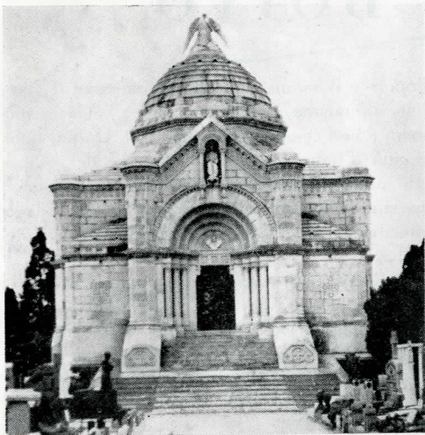
Cappella Ponti (1864) - Gallarate

E fu particolarmente in questo periodo che le maggiori città d'Italia ebbero mutamenti sostanziali con aperture di vie nuove, con sistemazioni di piazze, con creazioni di piani regolatori per decongestionare i grandi centri. I principali architetti che operarono in questo secondo periodo furono: a Roma, Virginio Vespignani (1808-1882), che restaurò la parte absidale di S. Giovanni in Laterano; Gaetano Kock (1849-1910), che progettò Piazza Esedra e fu autore del palazzo della Banca d'Italia in Via Nazionale; Pio Piacentini (1846-1928) col palazzo delle Arti o delle Esposizioni in Via Nazionale, e quello del Ministero di Grazia e Giustizia; Giuseppe Sacconi (1854-1905) autore del Monumento a Vittorio Emanuele II in Piazza Venezia; Guglielmo Calderini (1837-1916) progettista del Palazzo di