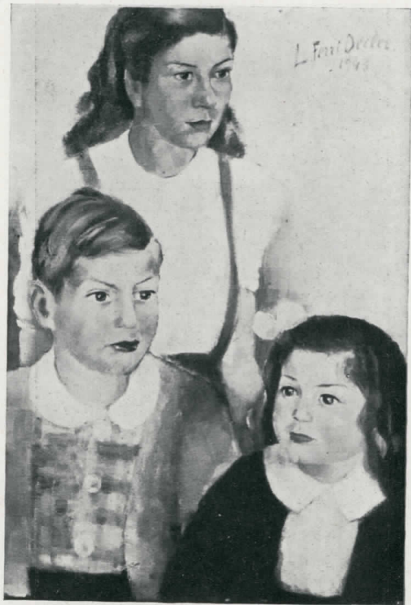
I miei bambini