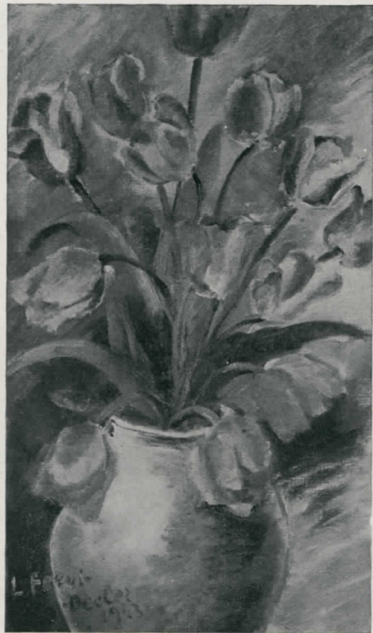
I tulipani rossi