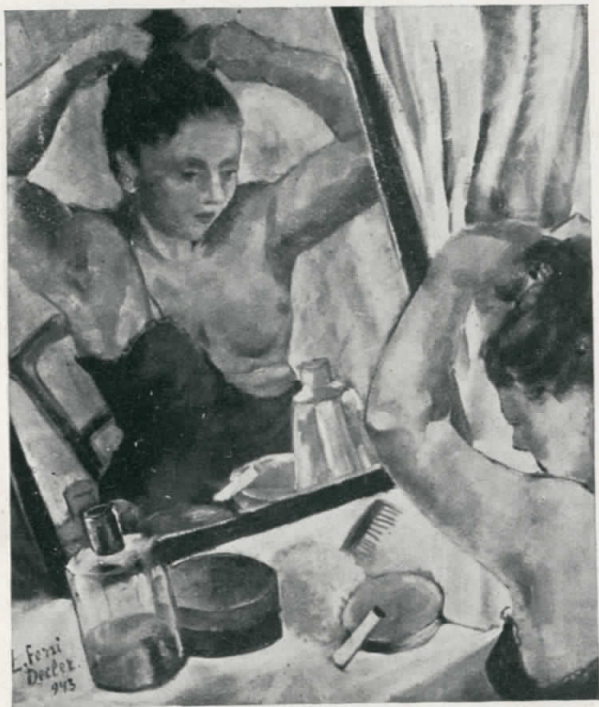
Donna allo specchio