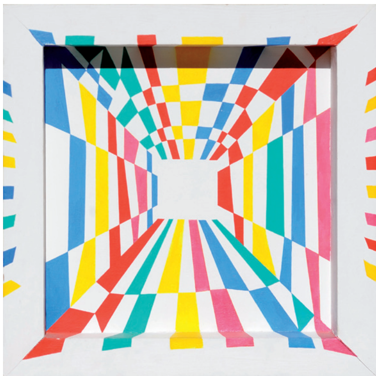
▼ Francesco Guerrieri, Interno d'Artista , 2000 [acrilico su tela e legno, cm. 40 x 40]

non avesse inizio né fine, ma fosse parte, frammento di una potenziale illimitata continuità”, per citare le parole dello stesso artista, sempre “alla ricerca di una possibile realizzazione visiva del mistero della vita”. Questa frase si trova in una delle poesie di Guerrieri selezionate per il catalogo, L'arte contemporanea , “... libera di crearsi ogni volta le proprie regole, libera di spaziare nell'immaginazione molteplice e infinita ...”.