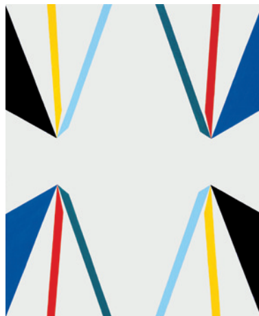
▲ Francesco Guerrieri, L'Infinito finito , 2011 [acrilico su tela, cm. 100 x 80]