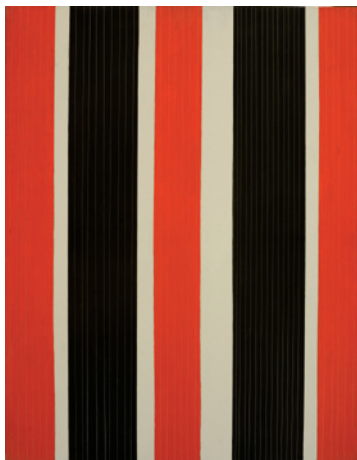
▲ Francesco Guerrieri, Continuità n.14 , 1962 [acrilico e fili di nylon su tela, cm. 130 x 100]