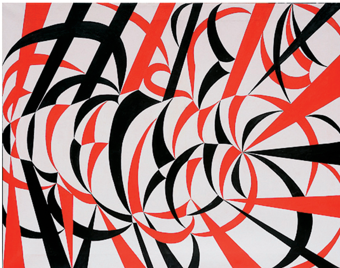
▼ Francesco Guerrieri, Dinamismo , 2011 [acrilico su tela, cm. 80 x 100]