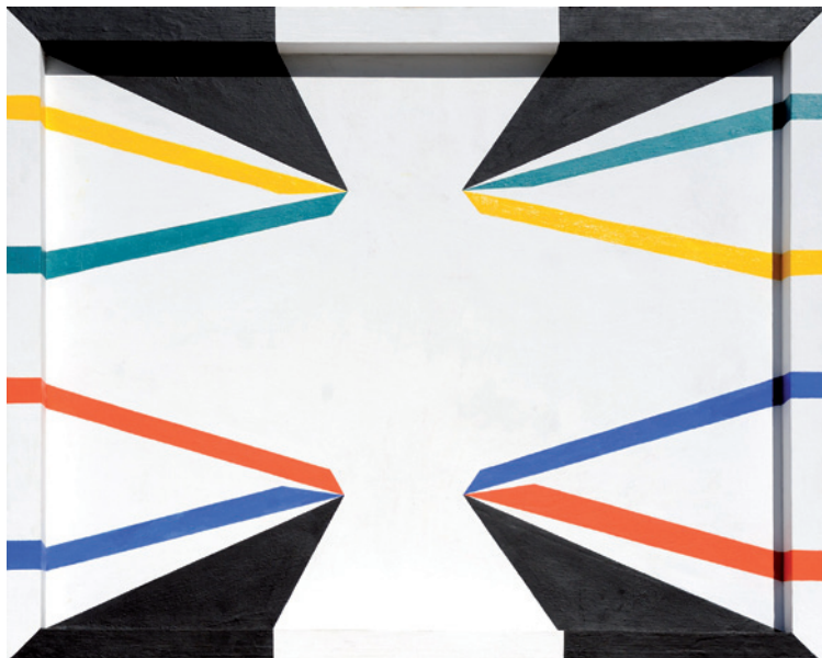
▲ Francesco Guerrieri, Direzione Infinito , 2011 [acrilico su tela e legno, cm. 80 x 100]