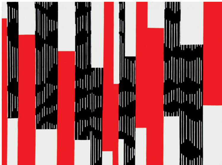
▲ Francesco Guerrieri, Ritmo B 12 [acrilico su tela, cm. 30 x 40]