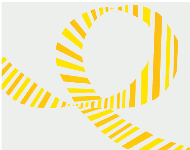
▲ Francesco Guerrieri, Criptoscrittura , 1973 [acrilico su tela, cm. 80 x 100 x 5]