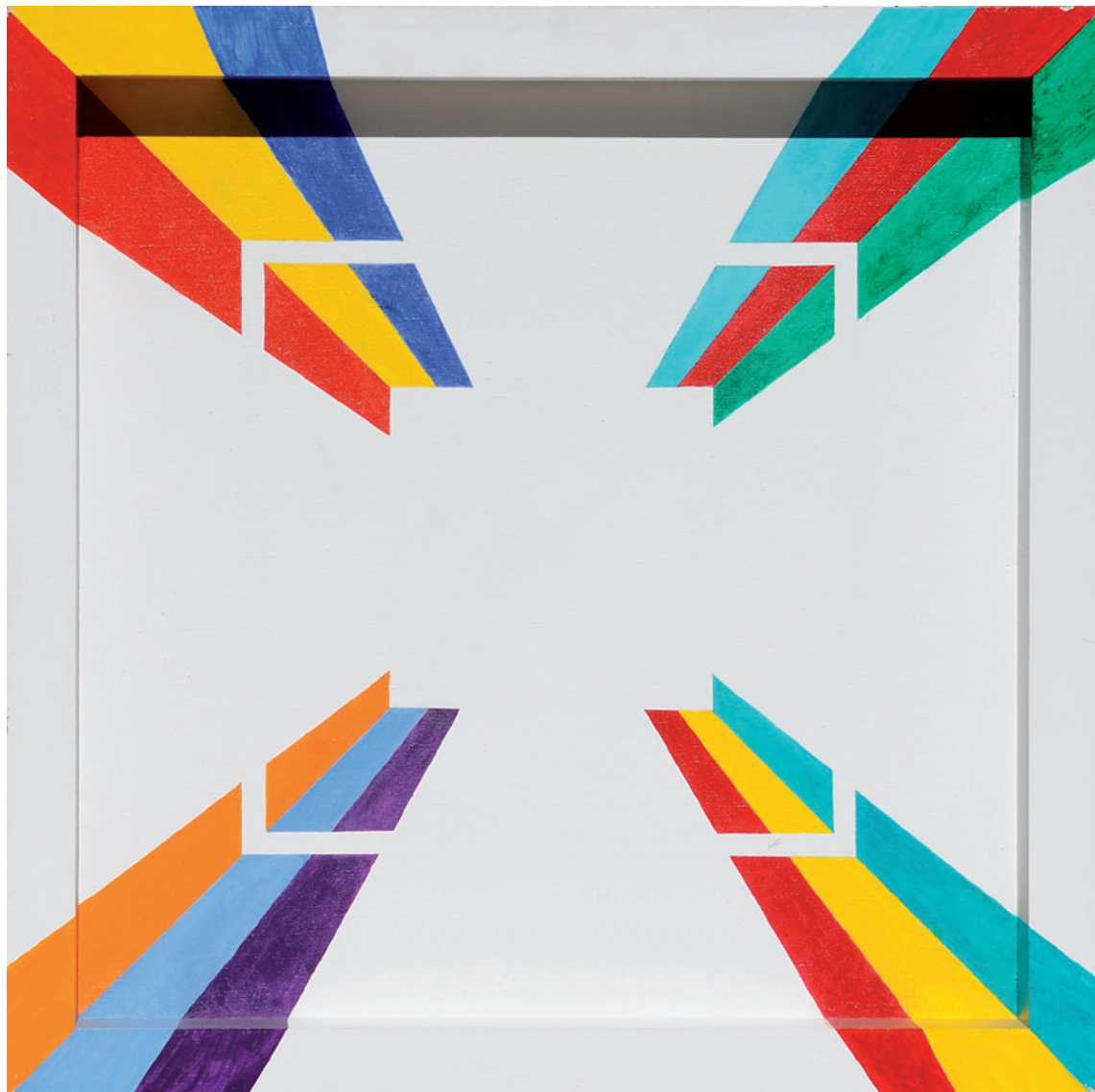
▲ Francesco Guerrieri, Nuovo Interno d'Artista , 2003 [acrilico su tela e legno, cm. 69,8 x 69,8]