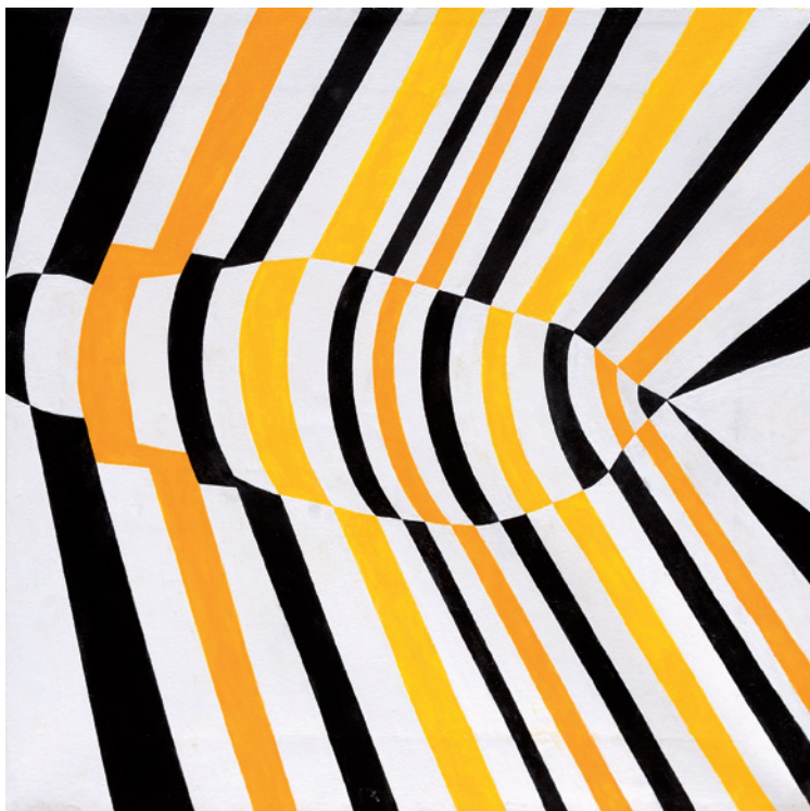
▼ Francesco Guerrieri, Angelo del mattino , 2011 [acrilico su tela, cm. 80 x 100]