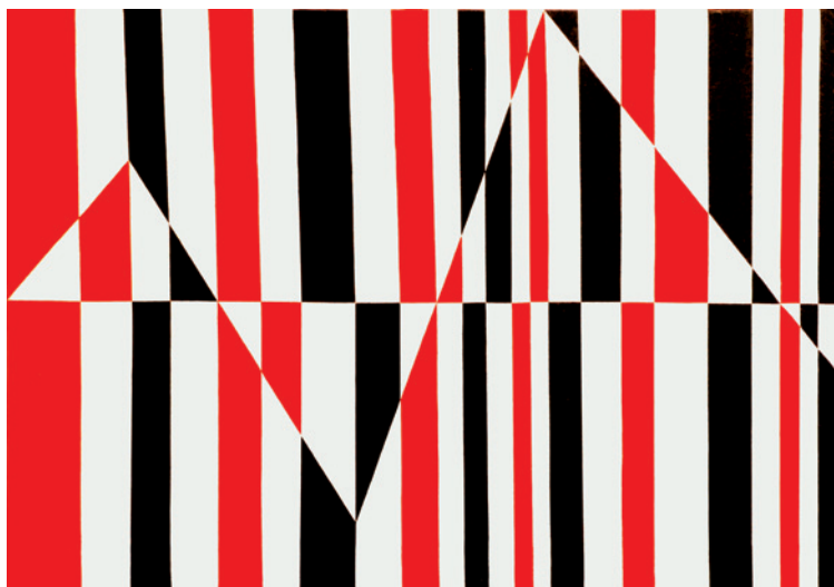
▲ Francesco Guerrieri, Ritmostruttura H10 , 1966, [acrilico su tela, cm. 50 x 70]