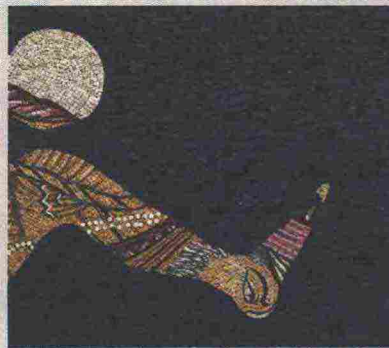
Un mosaico di Shahzia Sikander

● GALLERIA VALENTINA BONOMO , via del Portico d'Ottavia, tel. 06-6832766. Orario: 15-19; chiuso domenica e lunedì; dal 30 maggio.