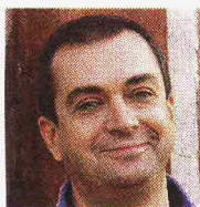
foto) insegna Storia dell'arte contemporanea nell'Università D'Annunzio a Chieti. E nell'ottobre scorso ha scritto una lettera aperta a