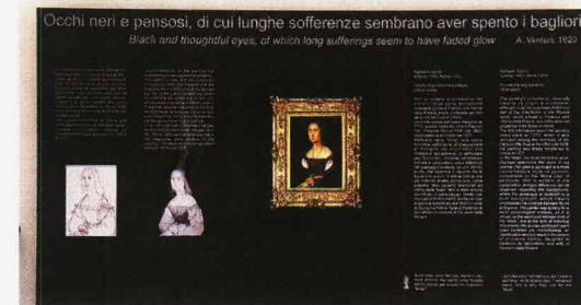
Il discorso riallestimento della «Muta» di Raffaello alla Galleria Nazionale di Urbino