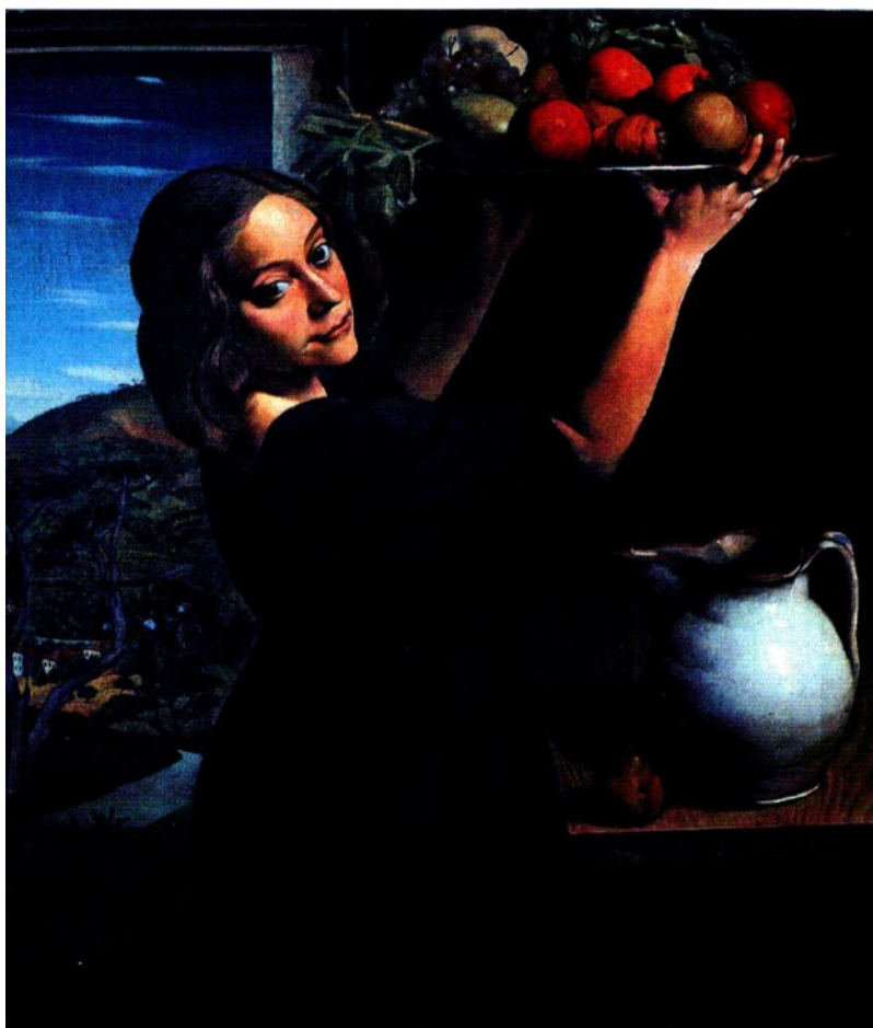
La terra, olio su tela, 1921.