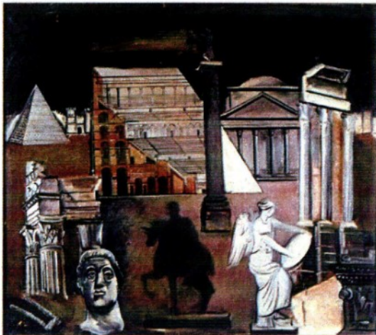
Roma, olio su tela, 1930 (ca.).

ARTICOLO NON CEDIBILE AD ALTRI AD USO ESCLUSIVO DEL CLIENTE CHE LO RICEVE - 870 - L.1980 - T.1623