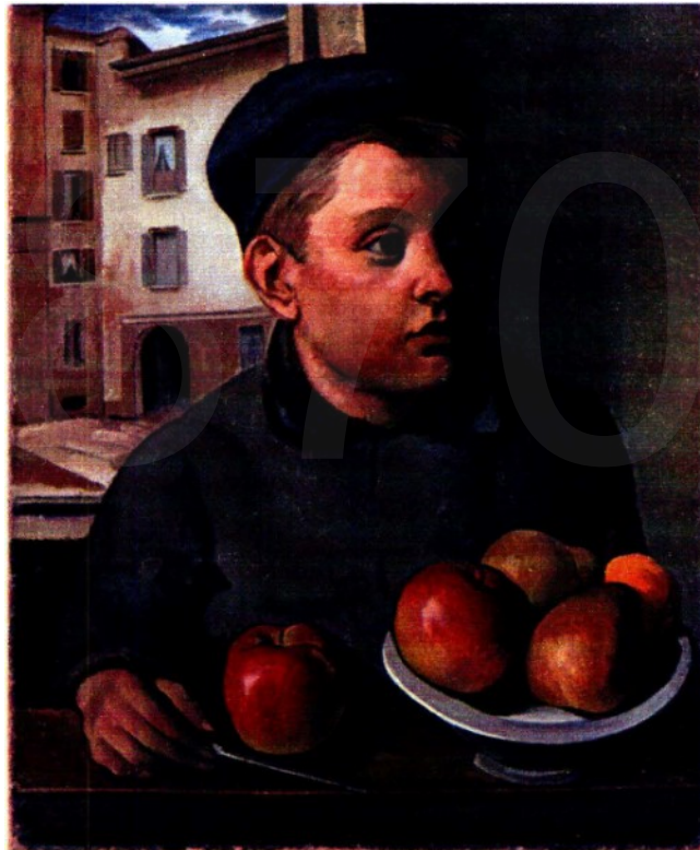
Il fantasma con le mele, olio su tela 1921.

«Uno dei maestri del moderno, legato alla tradizione e alle forme classiche dell'arte. Un pittore che ha aperto strade, un maestro di tanti giovani maestri». Così Vittorio Sgarbi definisce Achille Funi (1890-1972), che ora viene celebrato con una mostra articolata in una cinquantina di opere dal titolo Il volto, il mito al museo Mart di Rovereto (Tn). Curata da Nicoletta Colombo e Daniela Ferrari, inaugura il 3 ottobre e prosegue fino al 5 febbraio 2023. Info: www.mart.tn.it .