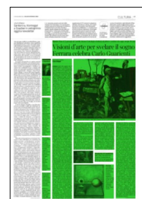
Superficie 66 %