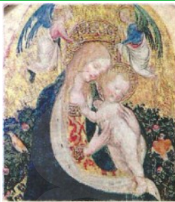
A sinistra, "Il Semiatore" di van Gogh; in alto, la Madonna della Quaglia di Pisanello e a destra "Oedipus rex", di Max Ernst