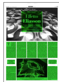
Superficie 62 %

Le tende che rabbuiano le finestre aggiungono un tocco romantico all'installazione: da esse filtrano, oscurati dal tessuto, i contorni del panorama circostante. E sembrano pae-