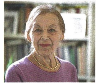
Edith Bruck