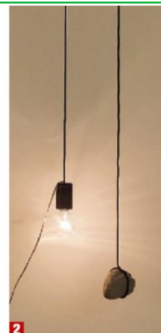
1 Shilpa Gupta, Stars on Flags of the World, July 2011, 2012 2 Shilpa Gupta, Stone And Bulb, 2020 3 Marisa Merz, Senza titolo

I NTRECCI di rame e nylon, come nidi, tane, architetture minime e silvestri. E poi bottiglie di vetro, cocci e parole sigillate sottovuoto, come una raccolta di poesie proibite, un libro trasparente di pensieri repressi.