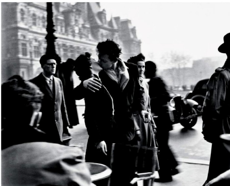
Le immagini di Robert Doisneau del 1950. A destra "Le baiser dell'Hôtel de Ville"; sotto, "Mademoiselle Anita, cabaret «La Boule Rouge»"