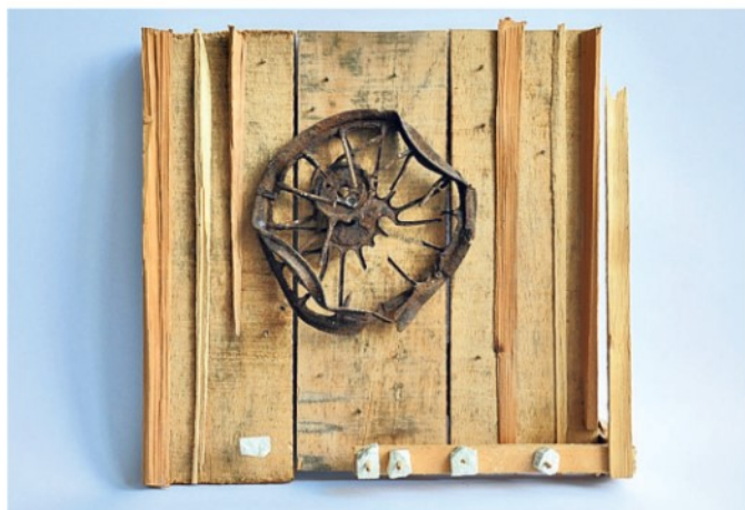
▲ La ruota dei ricordi Un'opera con legno, ferro e pietra