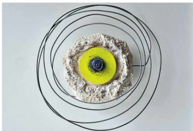
▲ Fiore del Salento È inedita e creata con vernici fluorescenti