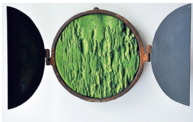
▲ Indiadolcenera La scultura di Sava per Fabrizio De André