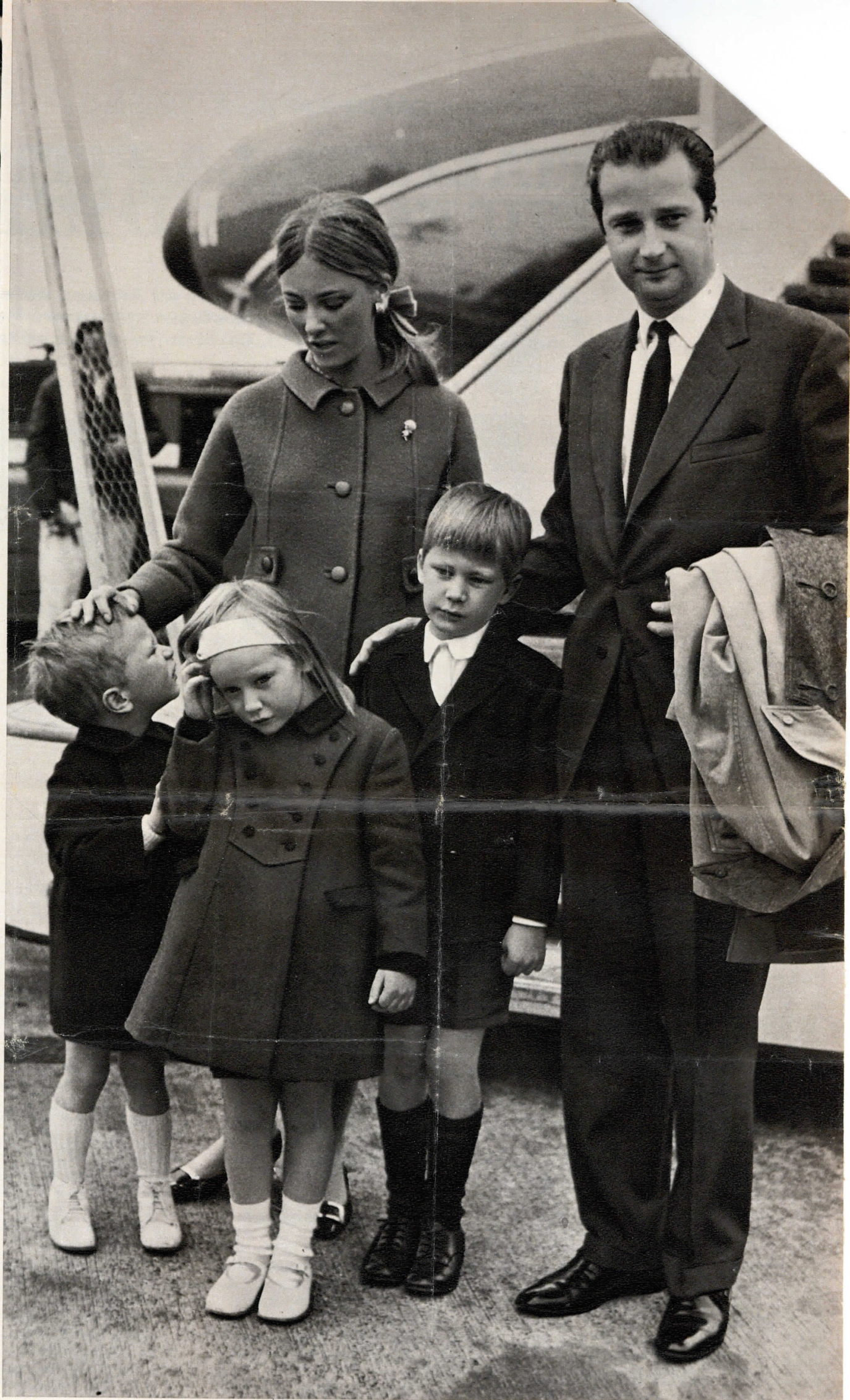
I Principi di Liegi con i loro tre bambini: il primogenito Filippo, che ha quasi otto anni, Astrid che ne compirà sei quest'anno e Lorenzo, nato nell'ottobre del '63. Se i sovrani del Belgio, come sembra ormai accertato, non potranno dare un erede alla corona, è molto probabile che il piccolo Filippo (il quale, tra l'altro, è il nipote preferito della regina Fabiola) venga designato erede al trono. Paola e Alberto si sono sposati a Bruxelles il 2 luglio 1959.