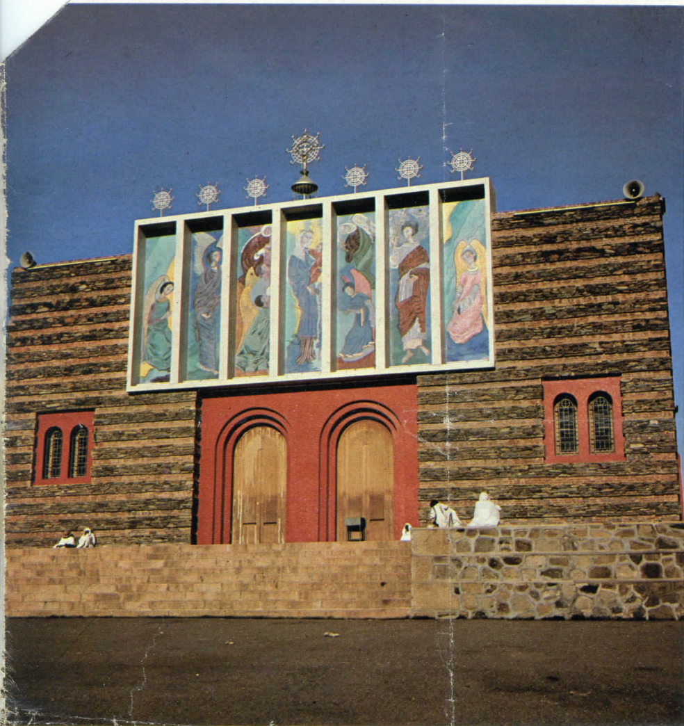
Una tipica decorazione murale dell'artista ligure: una serie di immagini sacre da lei eseguite sulla facciata della chiesa «Enda Mariam» all'Asmara. Oltre che pittrice, la Sanguineti è infatti autrice di molte decorazioni a mosaico, a bassorilievo e in ceramica.