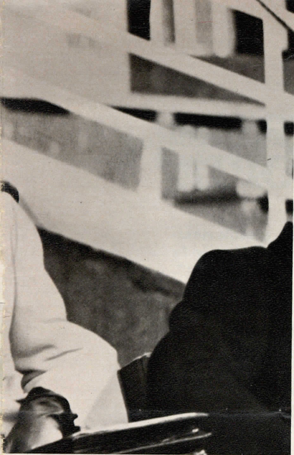
I Principi risiedono al Castello del Belvedere.

ricquistare la popolarità che aveva in parte perduto per giovanile impazienza.