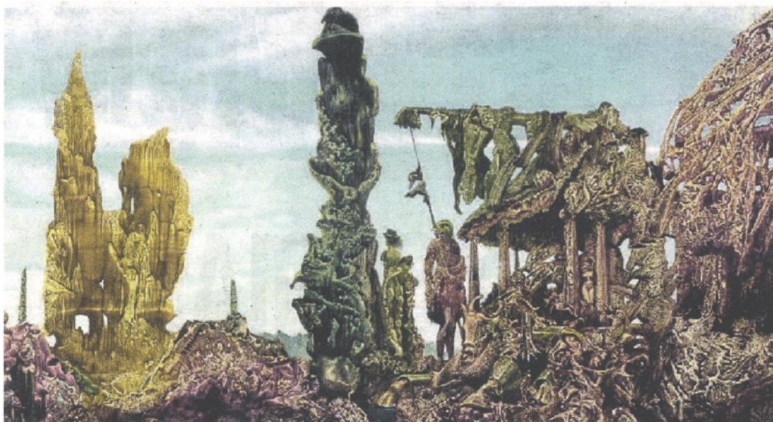
MOSTRE Un'opera di Max Ernst, nel tondo in alto Anish Kapoor