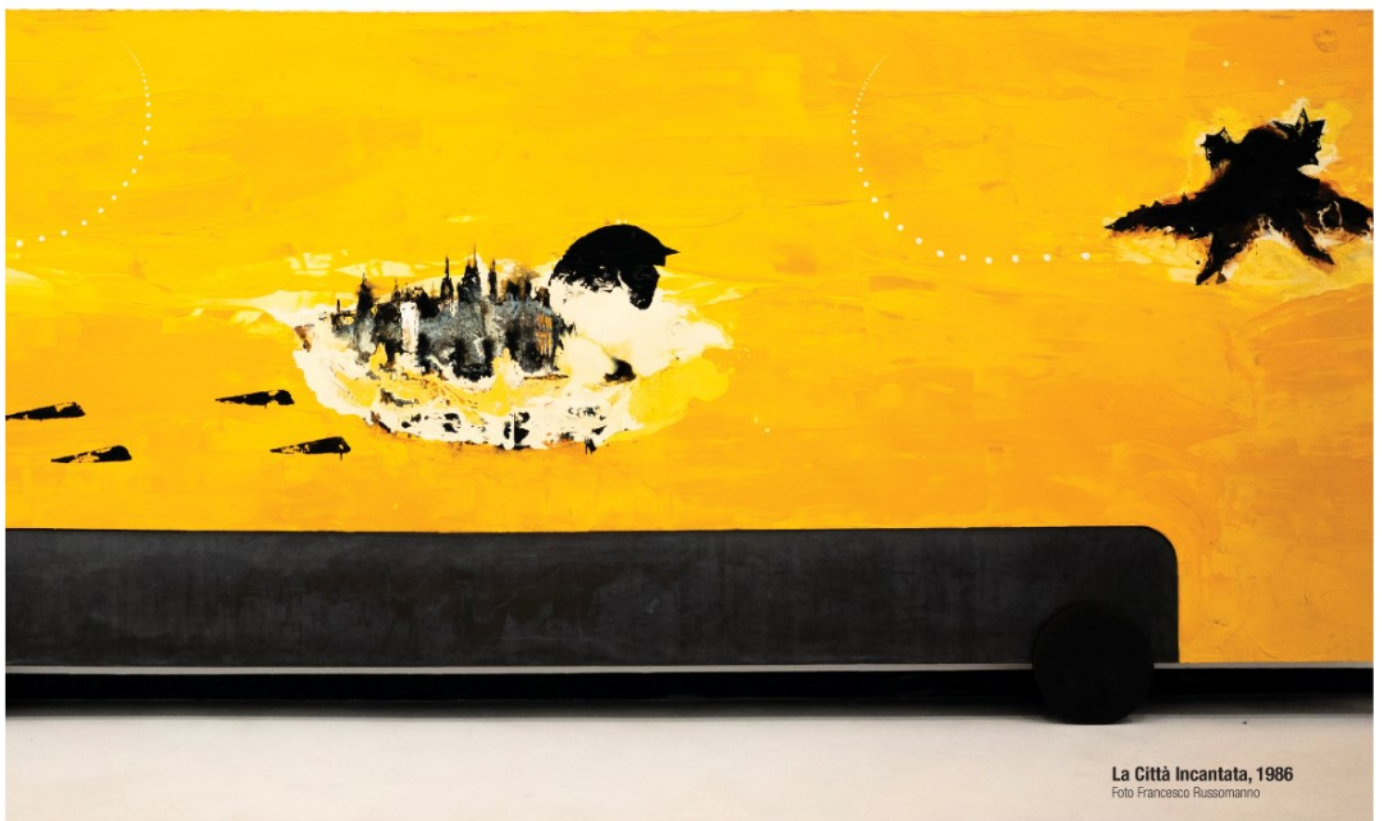
La Città Incantata, 1986

ARTICOLO NON CEDIBILE AD ALTRI AD USO ESCLUSIVO DEL CLIENTE CHE LO RICEVE - 870 - L.1878 - T.1675