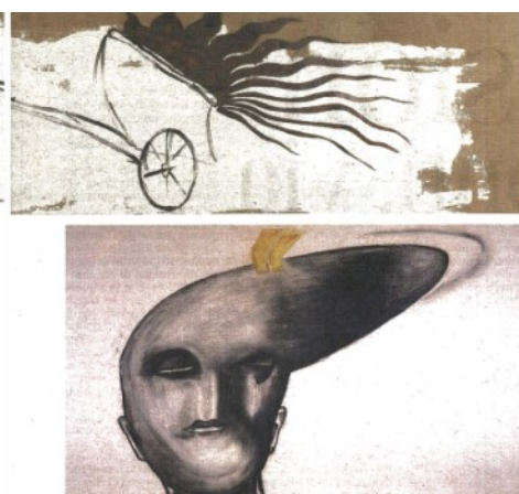
A sinistra: Enzo Cucchi; in alto: il Maxxi dedica all'artista racconta, grazie a una selezione di oltre duecento opere, l'universo creativo di Cucchi e la sua visione poliedrica della creatività. Nelle immagini qui a destra, tre lavori di Cucchi che saranno esposti nella Galleria 4 del museo romano: sopra, Lo bigo di Giotto (1990, particolare); sotto, A terra d'uomo e, a destra, I piedi di Corovaggio (1993)