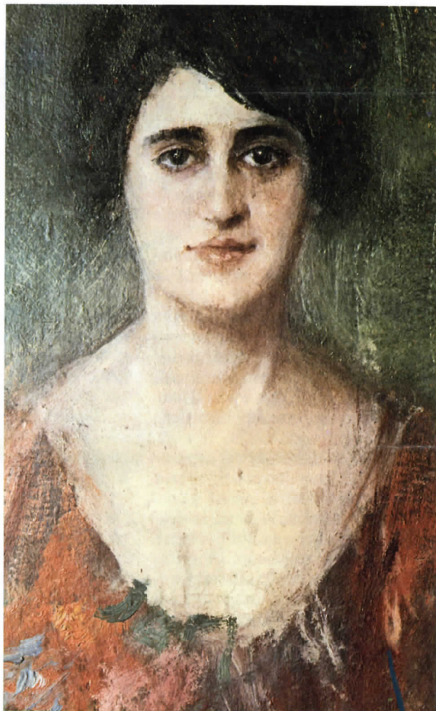
Ritratto di donna

te ancorato all'amico e maestro romano mentre i paesaggi e molte figure sono liberi da ogni remora ed appaiono nella loro realtà più appariscente facendo sentire i problemi estetici che stavano maturando nei primi anni del Novecento. La salvaguardia dei propri valori di un temperamento conservatoristico rimane sempre valida e non viene meno neppure nel vortice della vita della « capitale ».