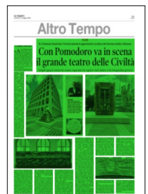
Superficie 91 %

ARTICOLO NON CEDIBILE AD ALTRI AD USO ESCLUSIVO DEL CLIENTE CHE LO RICEVE - 870 - L. 1997 - T. 1997