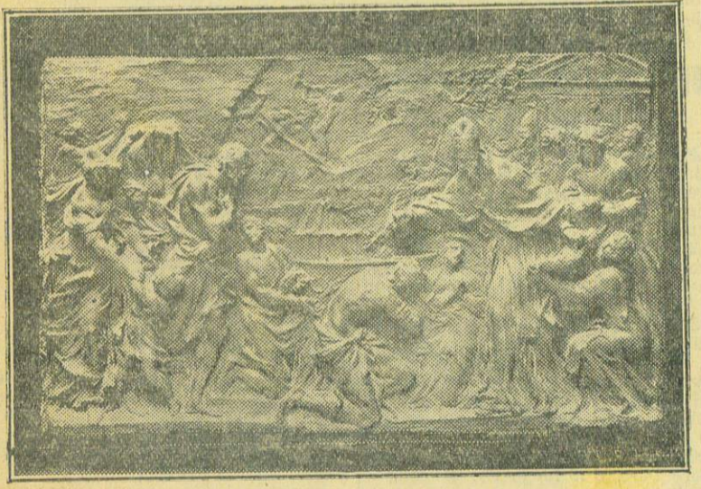
GIAMBOLOGNA — Battesimo di Costantino

Basta, ad esempio, osservarne il paesaggio così simile a quelli eseguiti in detta porta (specialmente sulle quattro fornelle superiori) nei particolari delle rupi, delle piante, degli animali e del piccolo ruscello con quel lieve ondeggiare dell'acqua (particolare questo del tutto caratteristico e più volte ripetuto in modo quasi sempre eguale), e in genere tutta la prospettiva della quale il Ghiberti fu profondo innovatore, riuscendo per primo ad imitare la natura, come egli ebbe a scrivere... « mi ingegnai con ogni misura osservare in esso cercare imitare la natura quanto a me fosse possibile, et con tutti i miglioramenti che in essa potessi pro-