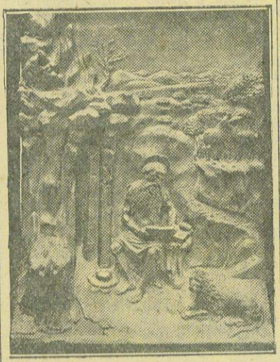
GHIBERTI — S. Girolamo nel deserto.

Invero — specialmente ai grandi Artisti — capita sovente che, in particolare le opere giovanili e gli studi loro, quando non siano storicamente identificati, la critica